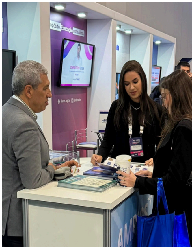
Entidade contou com estande no evento

Além do cronograma científico, a entidade gaúcha participou com estande institucional, no qual apresentou duas de suas principais iniciativas: a Prova AMB/AMRIGS, processo seletivo nacional para Programas de Residência Médica; e o Prêmio AMRIGS de Melhores Práticas na Medicina, que reconhece projetos inovadores e de impacto positivo no sistema de saúde. No local, os congressistas puderam esclarecer dúvidas e conhecer os detalhes das ações diretamente com a equipe da AMRIGS.